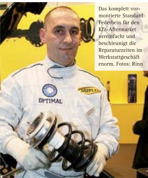
Das komplett vormontierte Standard-Federbein für den Kfz-Aftermarket vereinfacht und beschleunigt die Reparaturzeiten im Werkstattgeschäft enorm.